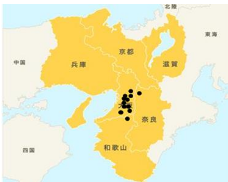
近畿大学眼科関連施設の分布図 (●関連施設)

当教室は専門研修基幹施設である近畿大学附属病院(大阪狭山市)の他に関連 12 施設を有する。これらの施設に、当教室の医局員 24 名の医師が派遣されている。この現場を活かし、専門研修基幹施設だけでは経験が不足しがちな初期の一般的な疾患など幅広く研修を行える場を提供する。大学附属病院での最先端の専門的診療経験と地域病院での即戦力となる臨床経験によって、眼科専門医を育てることが当プログラムの目指すところである。